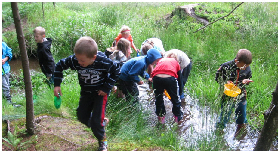
Výuka v terénu

V průběhu školního roku 2011/2012 jsme inovovali školní vzdělávací program z pohledu větší provázanosti klíčových kompetencí, průřezových témat a očekávaných výstupů v rámci jednotlivých období. Největší změny bylo dosaženo v předmětech prvouka, přírodověda a vlastivěda. Tvůrčí týmy na základě očekávaných výstupů RVP stanovovaly výstupy nového ŠVP, ty pak aplikovaly na tematické celky učiva jednotlivých ročníků. Nedílnou součástí nového školního programu je nový dlouhodobý plán EVVO , který definuje cíle a strategie. Přílohou plánu je roční plán aktivit a akcí , se kterými se na začátku školního roku počítá jako doplněk pochopení ale i testování látky. Vyhýbáme se tak nahodilosti, z každého programu pak vznikají patřičné studijní výstupy od pracovních listů až po články a obrázky do obecního zpravodaje, které hodnotíme stejně jako ostatní žákovské výstupy novým systémem hodnocení.