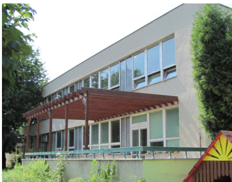
Budova školy před rekonstrukcí