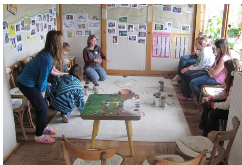
Půda není nuda — akce LIPKA

V rámci projektu Moderním hodnocením školy a žáků ke kvalitnější výuce na ZŠ Ostopovice se pedagogický sbor shodl na jednotném postupu výuky v rámci školy. Jsou nastaveny společné metody a formy práce, které budou jednotně využívány. Tento postup pedagogie na jednu stranu zavazuje, na druhou je transparentní a tvoří jakousi bázi výchovně vzdělávacího procesu. Pro učitele i žáky jsou postupy čitelné během celých pěti let navštěvování naší školy. Je samozřejmě nutná diference dle možností jednotlivých žáků.